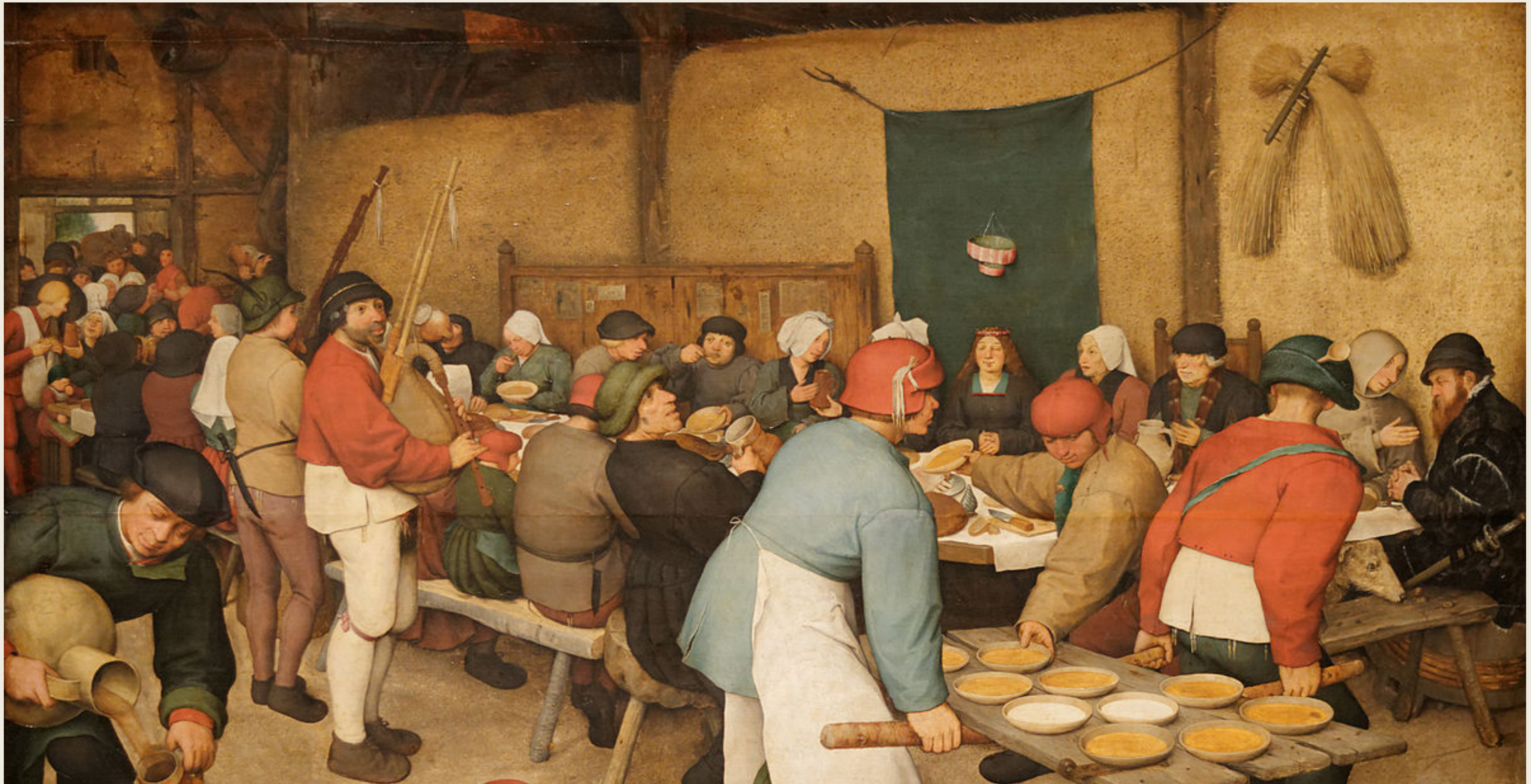
Le repas de noces, Pieter Bruegel l'Ancien