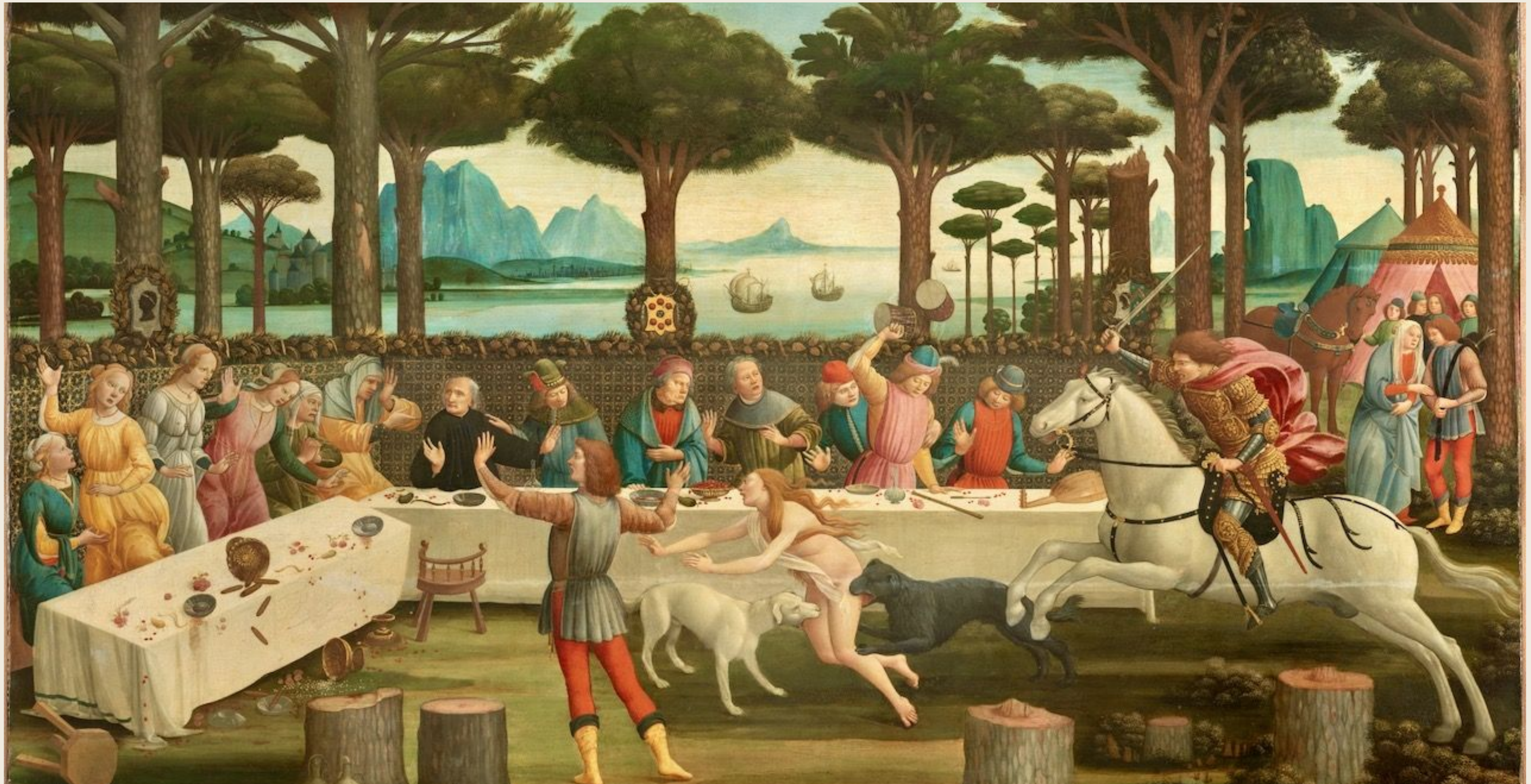
Le banquet dans la pinède, Sandro Botticelli