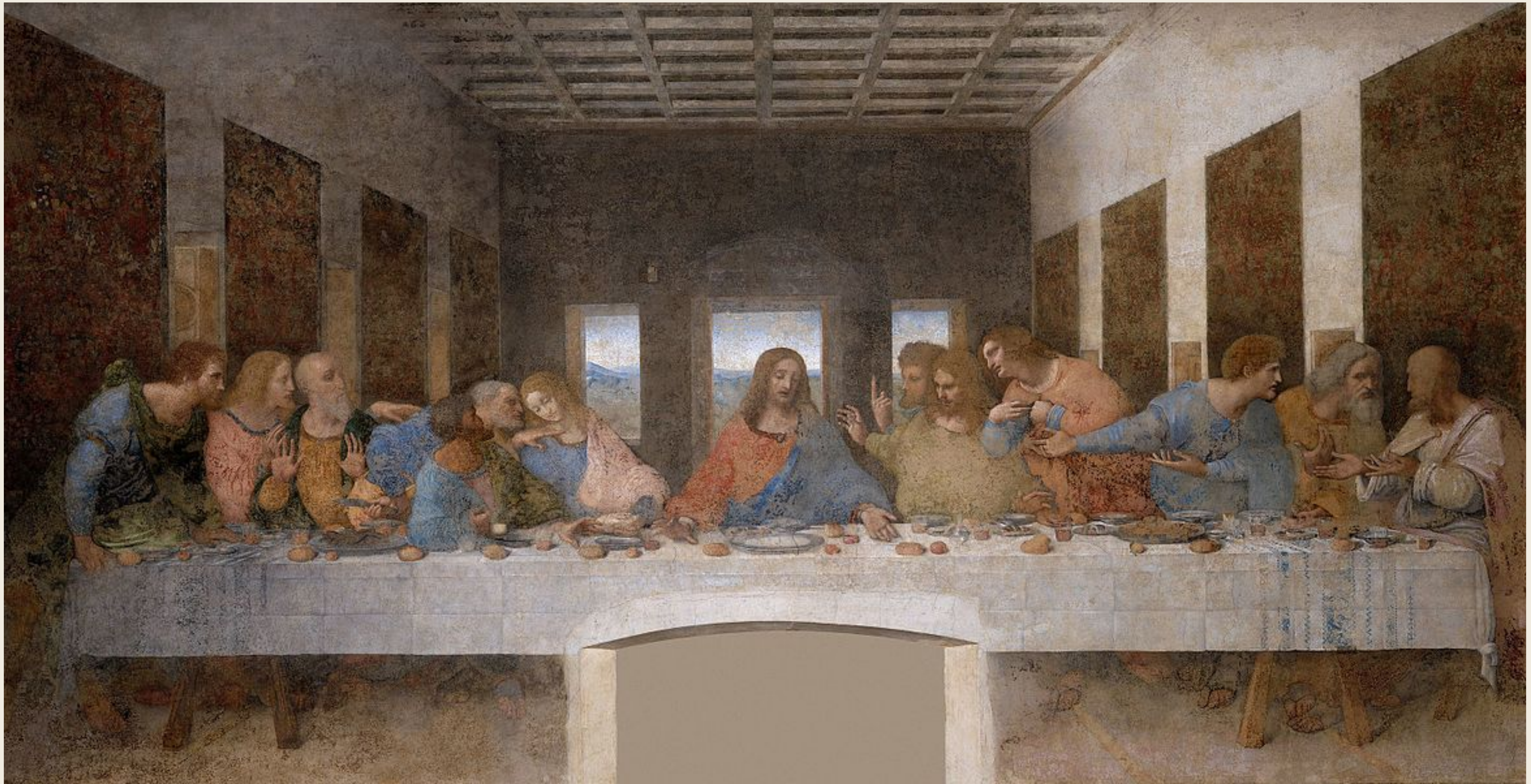
La Cène, Léonard de Vinci