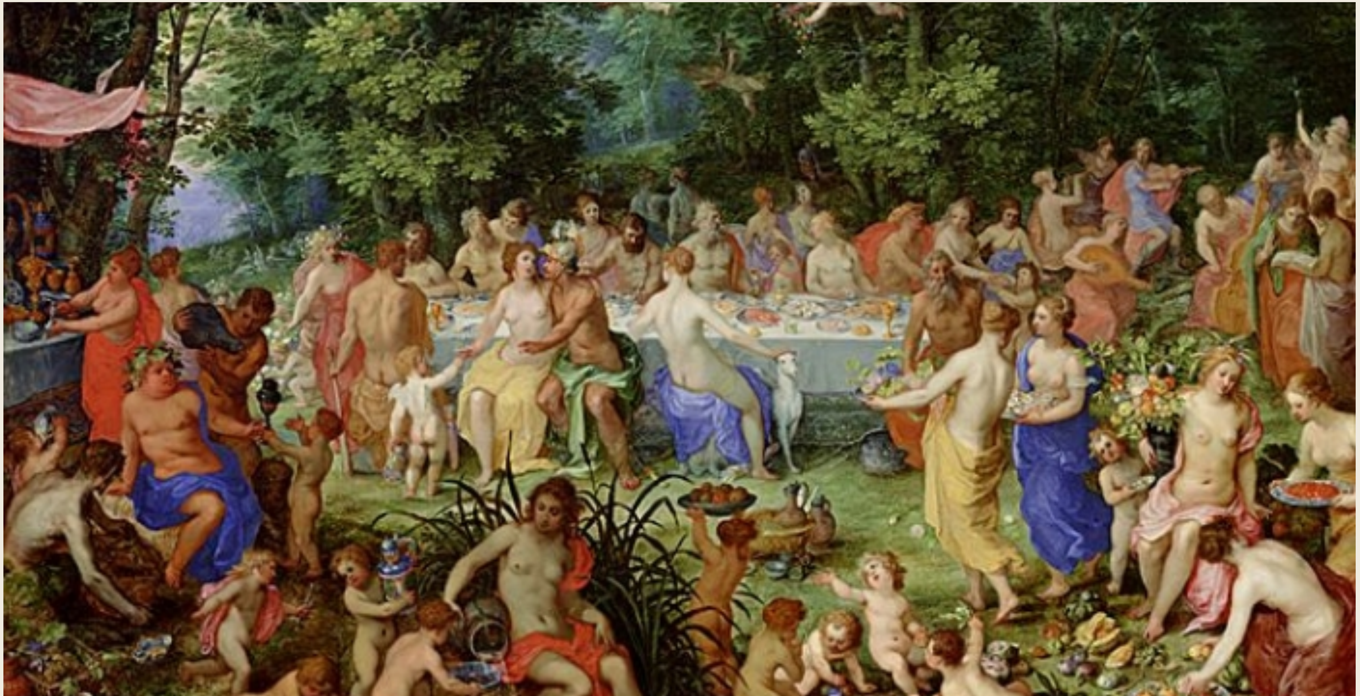
Le banquet des dieux, Hendrick Van Balen et Breughel