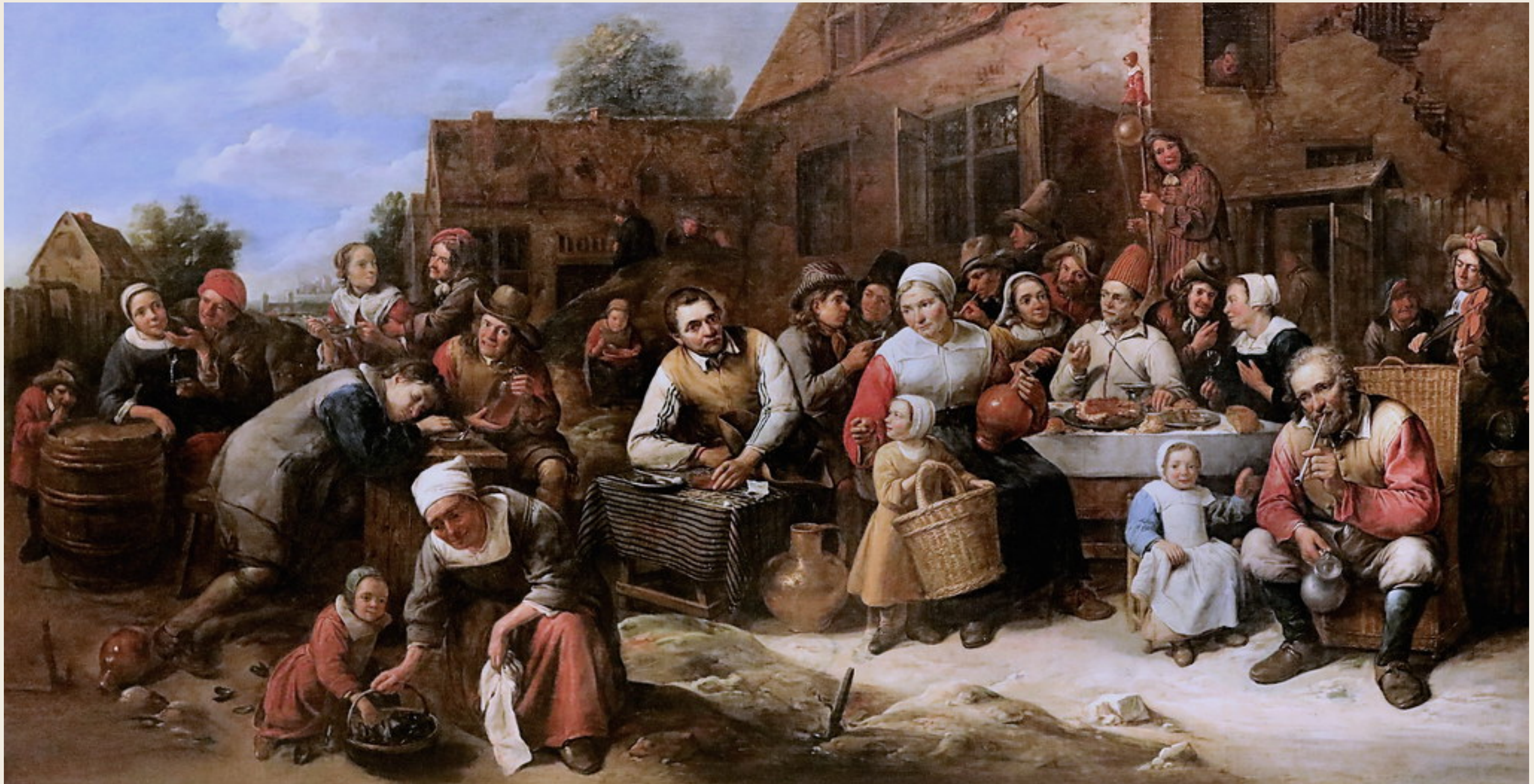
Banquet villageois, Gillis van Tilborch.